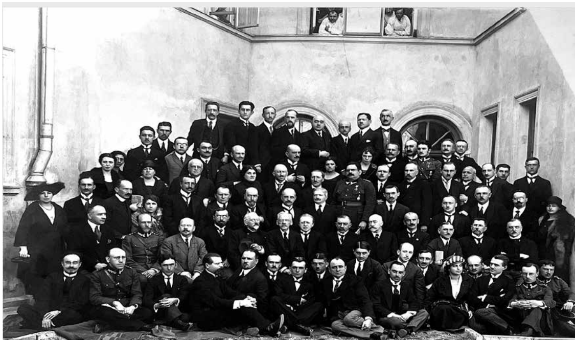
Figure 4. The first Congress of the PTD in 1922 in Warsaw Rycina 4. Pierwszy Zjazd PTD w 1922 roku w Warszawie