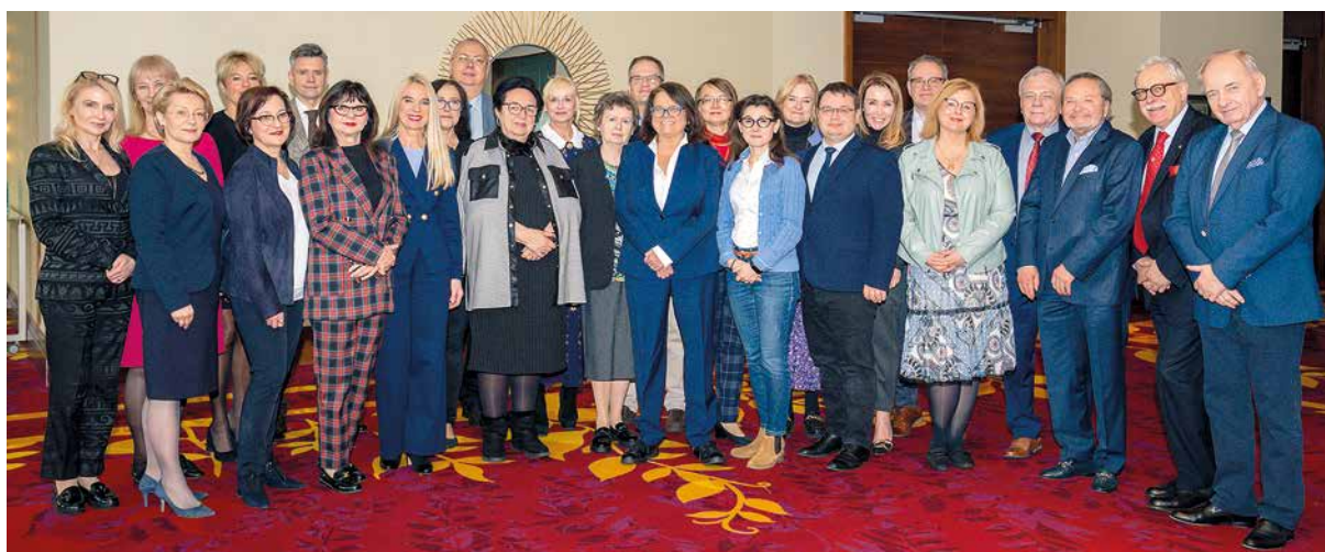
Figure 21. A break in the meeting of the Board of PTD. Warsaw, 2023

Rycina 20. Kadencja 2016–2023 obfitowała w inicjatywy i lobbowanie w sprawach dotyczących dermatologów w Izbach Lekarskich, Ministerstwie Zdrowia, Sejmie i Senacie RP