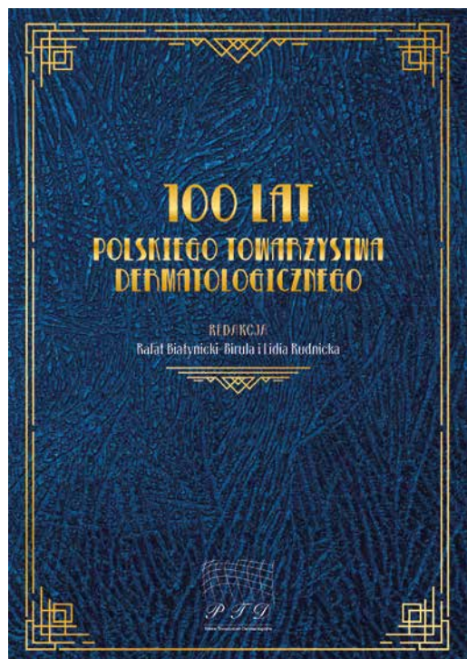
Figure 24. A monograph about the 100 year history of PTD contains 21 chapters and 513 pages

Rycina 24. Monografia na temat historii 100 lat PTD zawiera 21 rozdziałów na 513 stronach