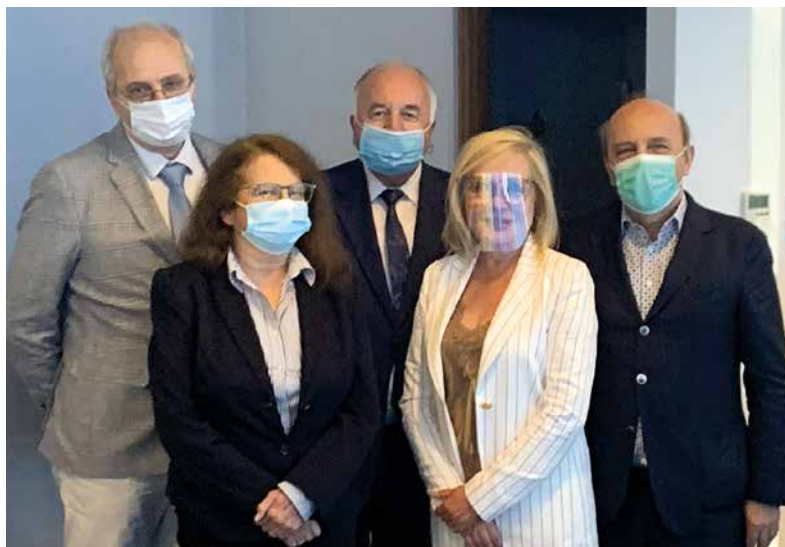
Figure 20. The 2016–2023 term was full of initiatives and lobbying on matters concerning dermatologists in Medical Chambers, the Ministry of Health, the Sejm and the Senate of the Republic of Poland

Rycina 20. Kadencja 2016–2023 obfitowała w inicjatywy i lobbowanie w sprawach dotyczących dermatologów w Izbach Lekarskich, Ministerstwie Zdrowia, Sejmie i Senacie RP