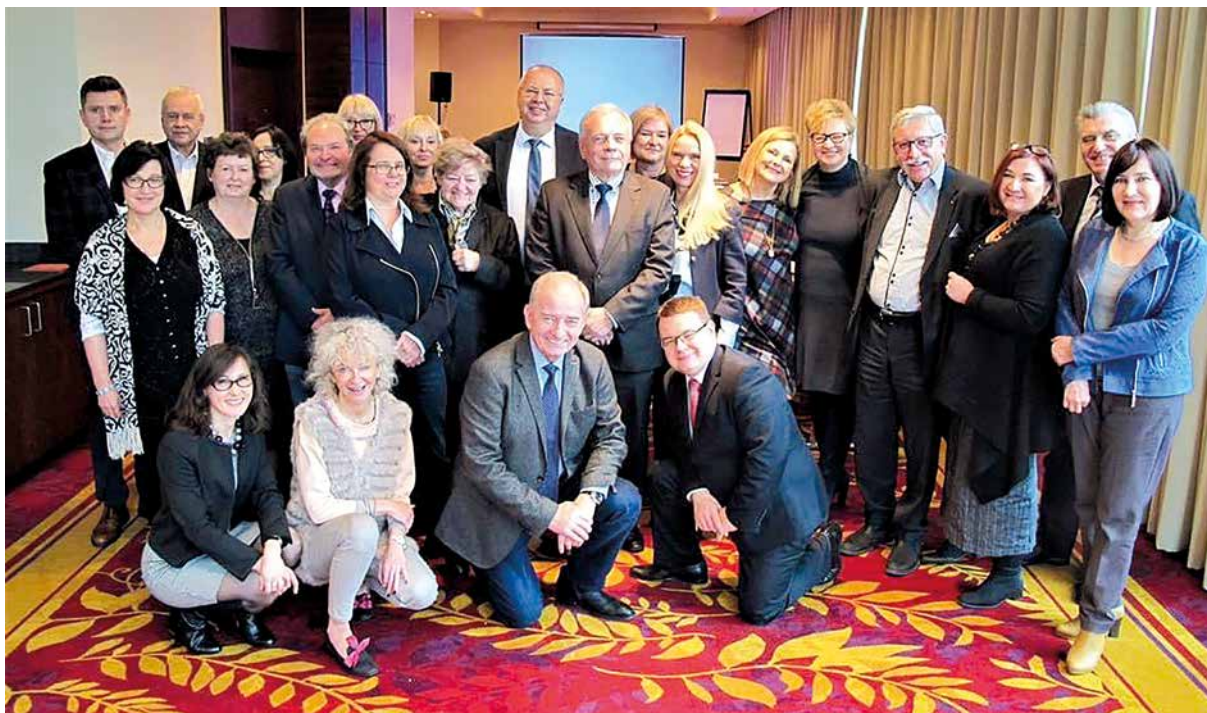
Figure 15. A break in the meeting of the Board of PTD. Warsaw, 2017

Rycina 15. Przerwa w posiedzeniu Zarządu Głównego PTD. Warszawa, rok 2017