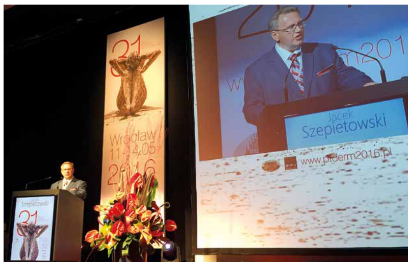
Figure 14. Professor Jacek Szepletowski in opening the Congress in 2016

Rycina 14. Profesor Jacek Szepletowski otwiera Zjazd PTD we Wrocławiu w 2016 roku