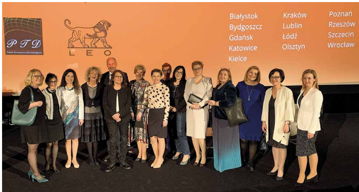
Figure 19. In the 2016–2023 term, the president and the board of PTD organized numerous educational events in cooperation with companies, including the annual Dermatology Step_by_Step conference in cooperation with LEO Pharma, annual dermoscopy courses under the patronage of PTD together with L'Oreal, a course in dermatosurgery in cooperation with Novartis and an educational application in cooperation with Pierre Fabre

Rycina 19. Prezes i Zarząd PTD organizowali w kadencji 2016–2023 liczne przedsięwzięcia edukacyjne we współpracy z firmami, w tym m.in. corocznie konferencję „Dermatologia Krok_po_kroku” w Multikinie w ramach współpracy z firmą LEO Pharma, coroczne kursy dermoskopowe pod patronatem PTD razem z L'Oreal, kurs dermatochirurgii we współpracy z Novartis i aplikację edukacyjną w ramach współpracy z firmą Pierre Fabre