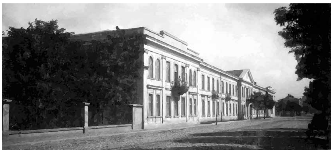
Figure 2. PTD headquarters from 1920 until now (2023)