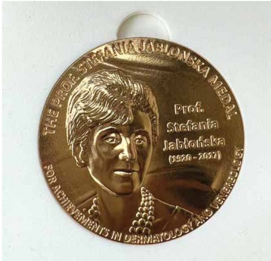
Figure 22. Professor Stefania Jabłowska Medal Rycina 22. Medal im. prof. Stefanii Jabłońskiej